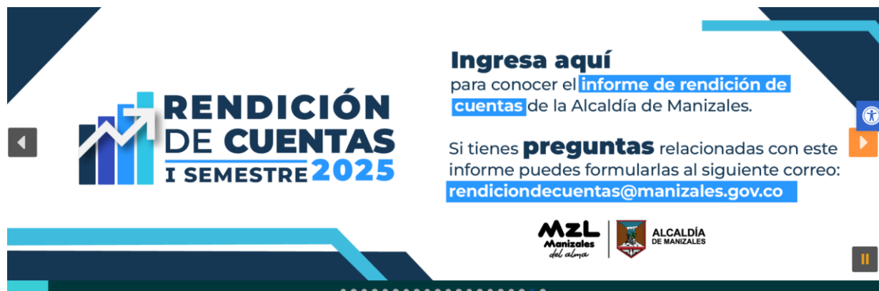
Imagen de la pieza publicitaria implementada para convocar a la rendición de cuentas

También se realizó una campaña de expectativa y una consulta ciudadana con respecto a los temas en los que se tiene mayor interés. En el correo electrónico referenciado, no se recibió ninguna solicitud, observación o sugerencia.